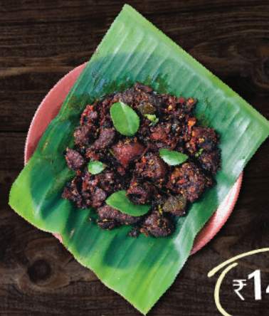
പർലും കെട്ടിയ പോത്ത് (Beef Fried with Kuchill Special Masala)