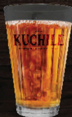
സുലൈമാനി (Sulaimani) ₹ 12