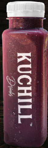
മുന്തിരിങ്ങ ജൂസ് (Grape Juice)