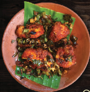
ചെറിയ കോയി കാച്ചിയത് (Small pieces chicken fry)