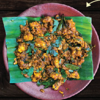
ആടിന്റെ ബ്രൈൻ കാച്ചിയത് (Mutton Brain Fry)