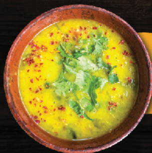
ബേളു കറി (Dal Fry)