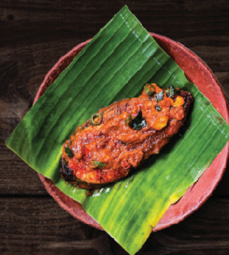
അയക്കൂറ കാച്ചിയത് (King Fish Fry)