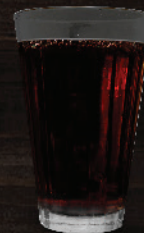
കട്ടൻ കാപ്പി (Black Coffee) ₹ 20