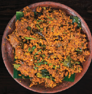
പോത്തിന്റെ പീര (Grated Coconut Beef Curry)

150g: ₹120 250g: ₹170 500g: ₹300 1 Kg : ₹600