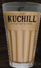
നെസ് കഫേ NESCAFÉ ₹ 25