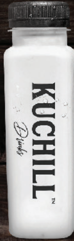
പൊണ്ട (Tender Coconut)