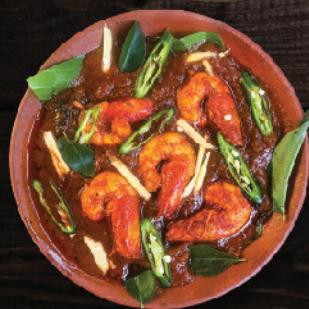
ചെമ്മീൻ മസാല (Prawns Masala)