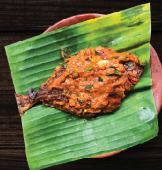
ആവോലി കാച്ചിയത് (Pomfret Fry)