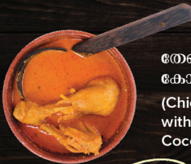
തേങ്ങ ചുട്ടുരച്ച കോയിക്കറി (Chicken Curry with Roasted Coconut)