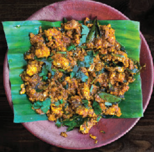
പോത്തിന്റെ ബ്രെയ്ൻ കാച്ചിയത് (Beef Brain Fry)