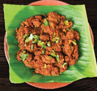
പള്ളിക്കറി (പോത്ത്) (Beef Palli Curry)

150g: ₹120 250g: ₹170 500g: ₹300 1 Kg : ₹600