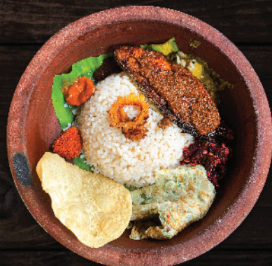
മീനിന്റെ കുടുംബം അയക്കൂറ Wonders of Fish (King Fish)