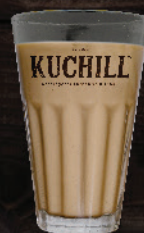
ബൂസ്റ്റ് / ഹോർലിക്സ് (Boost/Horlics) ₹ 25