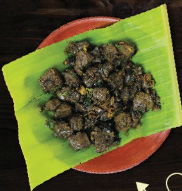
കർളിന്റെ കണ്ടം (Liver Fry)