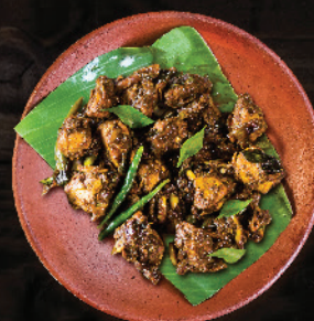
ചിക്കൻ കുരുമുളക് (Pepper Chicken)