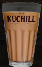
ചായ (Tea) ₹ 15