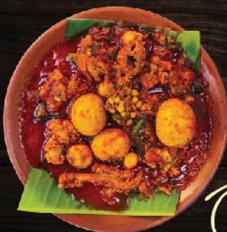
ദുതിയാവ് കാണാത്ത മുട്ട (Small Egg Parts Curry)