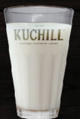
പാല് (Milk) ₹ 15