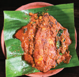
അയക്കൂറ മസാല (King Fish Masala)