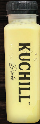
ദൂദ് കോൾഡ് (Doodh Cold)