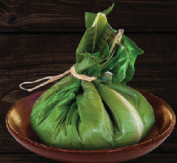
കെട്ടിയിട്ട പൊറോട്ട (കോയി / പോത്ത)