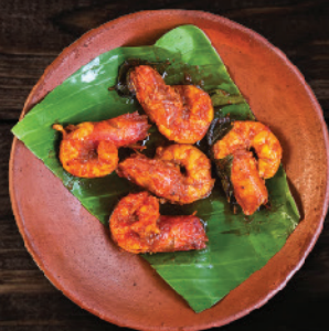
ചെമ്മീൻ കാച്ചിയത് (Prawns Fry)