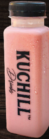
റൂ ഹഫ്സ് (Roo afza)