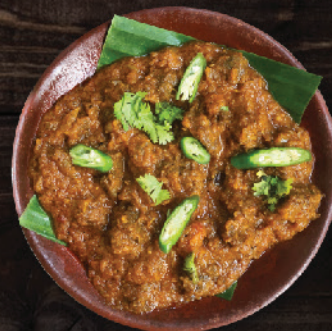
പോത്തിന്റെ മസാല (Beef Masala)