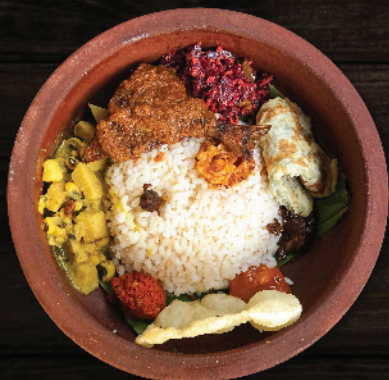
മീനിന്റെ കുടുംബം ആവോലി Wonders of Fish (Pomfret)