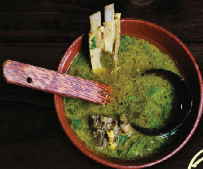
ആടിന്റെ ചോപ്പ് സൂപ്പ് (Mutton Chops Soup)