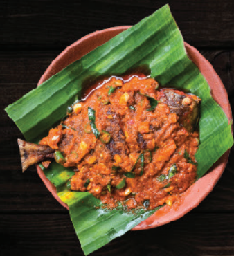
ആവോലി മസാല (Pomfret Masala)