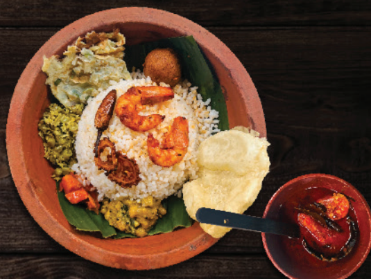
മീനിന്റെ കുടുംബം ചെമ്മീൻ Wonders of Fish (Prawns)