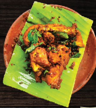
കോയി കാച്ചിയത് (Chicken Fry) Quarter