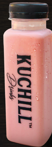
റൂ ഹഫ്സ് (Roo afza)