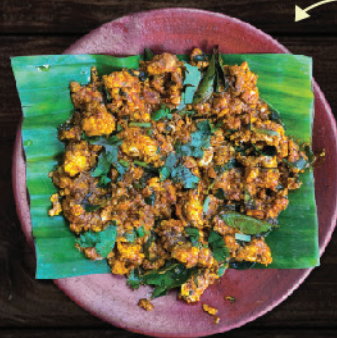
ആടിന്റെ ബ്രൈൻ കാച്ചിയത് (Mutton Brain Fry)