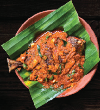
ആവോലി മസാല (Pomfret Masala) Seasonal Price