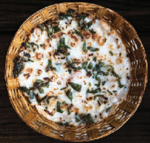
കൽത്തപ്പം (Kalthappam) ₹45