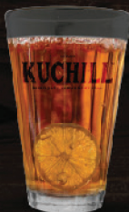
ലെമൺ ടീ (Lemon Tea)