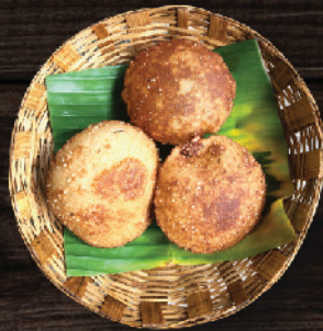
നെയ്പത്തൽ (Naipathal) ₹13