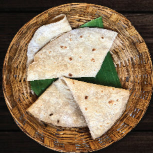
ചപ്പാത്തി (Chapati) ₹13