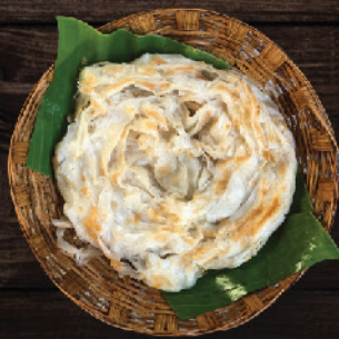
പൊറോട്ട (Porotta) ₹15