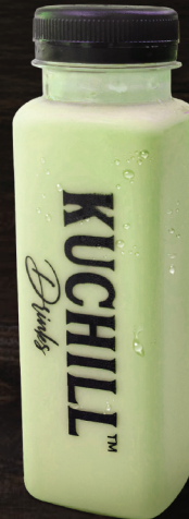
അവകാശോ (Avacado Juice)