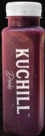
മുന്തിരിങ്ങ ജ്യൂസ് (Grape Juice)