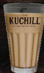
ബൂസ്റ്റ് / ഹോർലിക്സ് (Boost/Horlics)