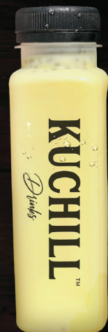
ദുദ് കോൾഡ് (Doodh Cold)