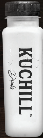
പൊണ്ട (Tender Coconut)