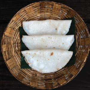
പത്തൽ (Pathal) ₹13